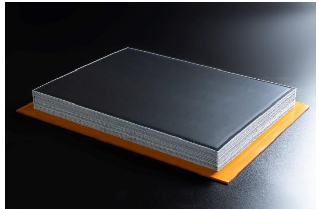
内部構造 (左写真モジュール内部) 40 枚の電池セルをバイポーラ積層し直列に接続